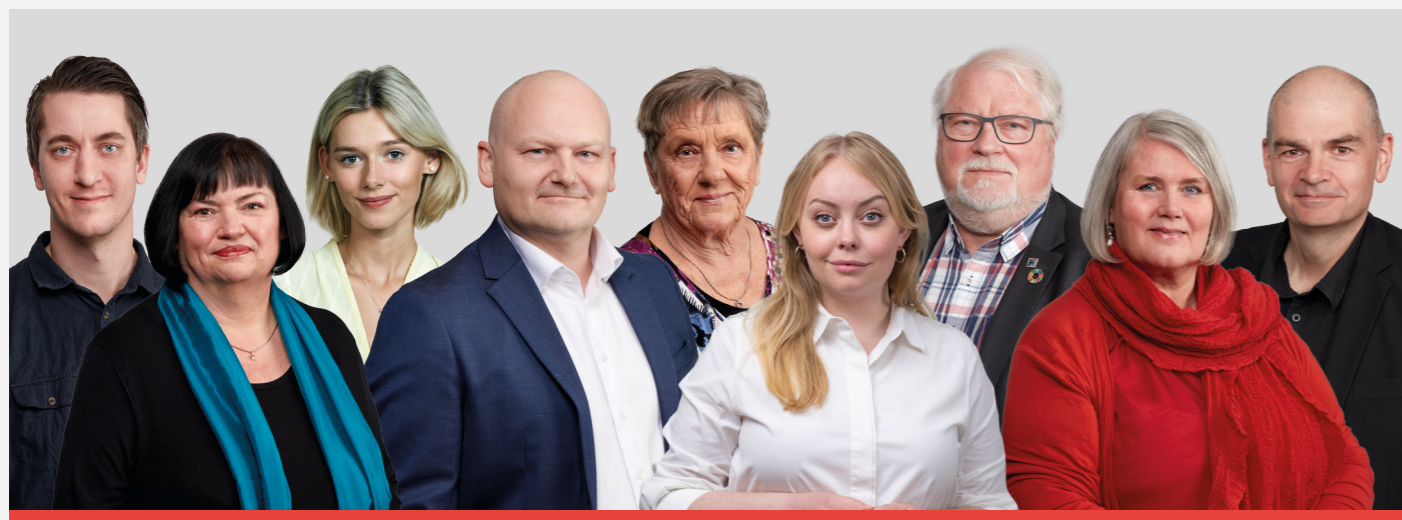
Af A-Gruppen i Region Hovedstaden

2023 var et travlt og udfordrende år. I den socialdemokratiske gruppe i Regionsrådet er vi tilfredse med resultaterne, og at vi atter har stået i spidsen for et bredt samarbejde i vores region.