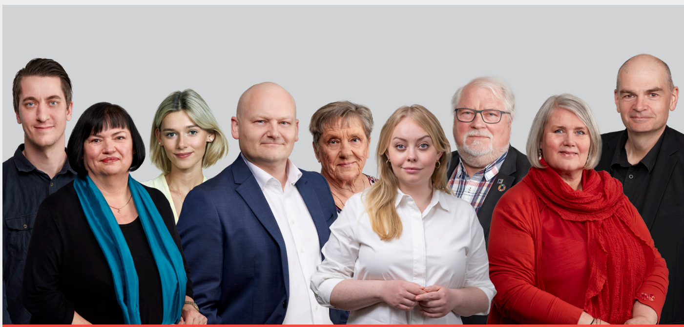
Af A-Gruppen i Region Hovedstaden